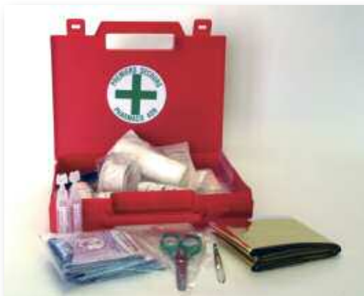
SEP651-01 Coffret Pharmacie ADR