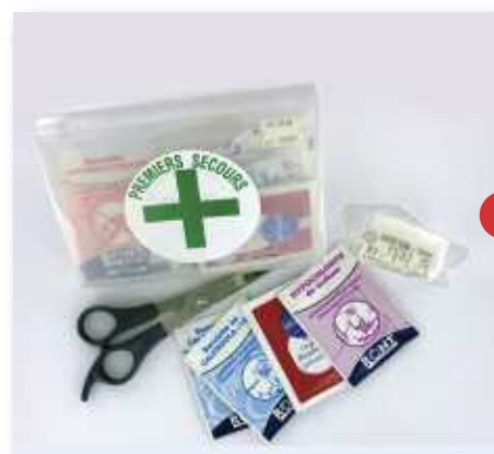
SEP650-05 Pochette Pharmacie